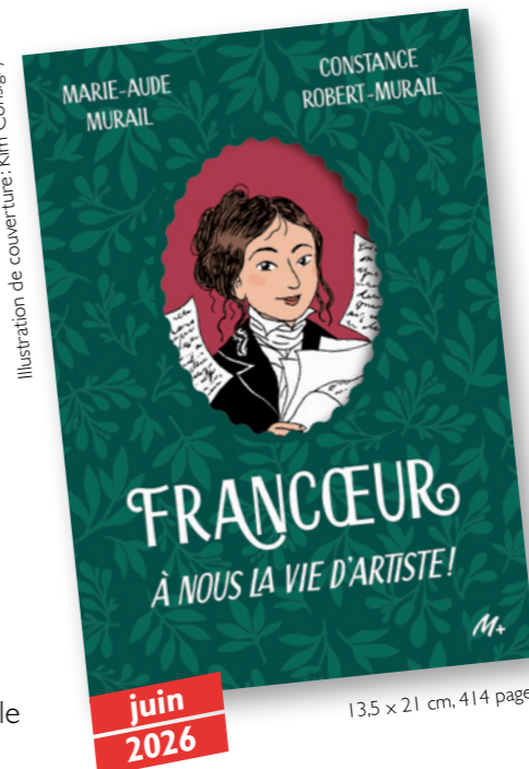
Illustration de couverture: Kim Consigny