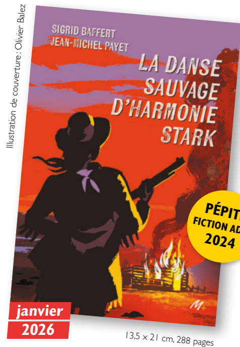
Illustration de couverture: Olivier Balez