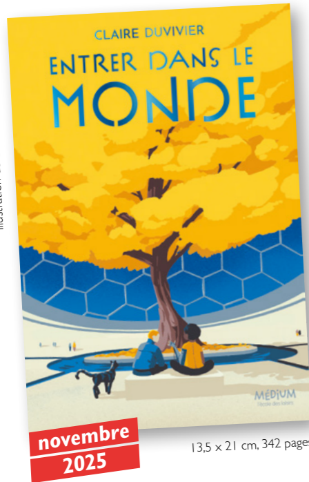
Illustration de couverture: Tom Haugomat